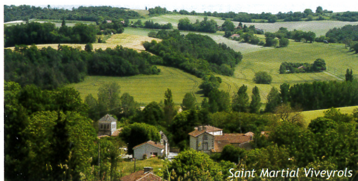
Saint Martial Viveyrols

Depuis le 1 er juillet 2015, la communauté de communes a mis en place un service mutualisé d'instruction des actes d'urbanisme de ses communes-membres. Les formalités administratives restent cependant inchangées pour l'usager qui dépose ses demandes et déclarations d'urbanisme à la mairie de son domicile.