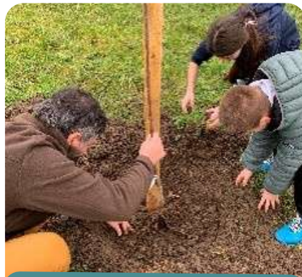
Chantier solidaire à Lisle