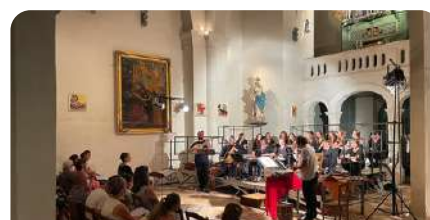
Festival Itinéraire Baroque