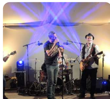
Concert Douchapt Blues