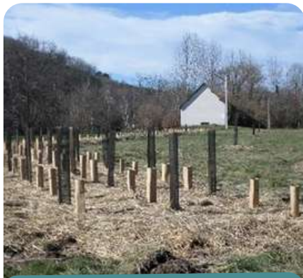
Plantations sur la zone humide de Lisle

Au total, tous types de végétaux plantés, cela représente 1.344 unités.