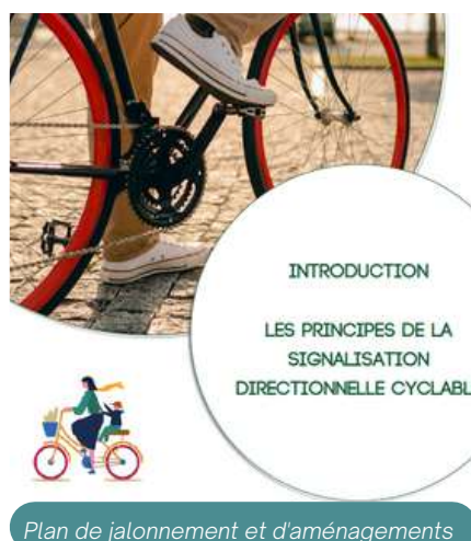
Plan de jalonnement et d'aménagements

Les étapes liées aux études et à l'ingénierie sont terminées, il s'agit désormais de réfléchir au déploiement du SDC (création de voies partagées, de sites propres) et de services associés (équiper les communes de bornes, d'arceaux vélo, etc.). Un projet à long terme pour la collectivité car les enjeux financiers sont très importants afin de pouvoir aménager le territoire.