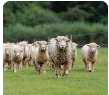
Transhumance et Éco pâturage