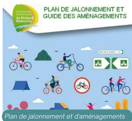
Plan de jalonnement et d'aménagements