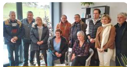
Institut "Chrysalide" à Tocane St Apre