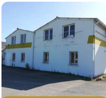
ZAE du Pontis à Verteillac