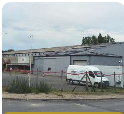
Besse et Aupy Technologies

La CCPR a décidé de vendre un de ses biens situé dans la zone d'activité du Pontis à Verteillac afin de soutenir le développement d'une entreprise d'électricité qui avait besoin d'un local pour stocker du matériel, créer un espace administratif et travailler dans de meilleures conditions et ainsi pouvoir se développer.