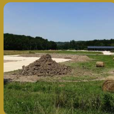
Zone Les Jarissous

La CCPR a également acheté un terrain à proximité du magasin Aldi à Villeteureix afin de l'aménager pour y accueillir des entreprises.