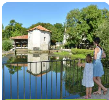
Moulin de la Maison de la Dronne