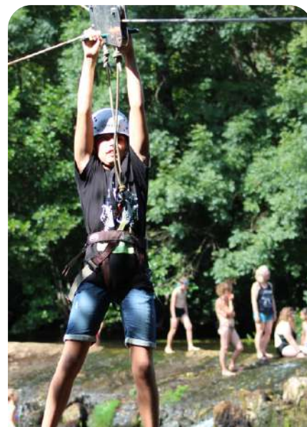
JOURNÉE SENSATION à Rochereuil Le 3 août - Sur réservation

Animation Gratuite - Renseignements au 05.53.90.03.10