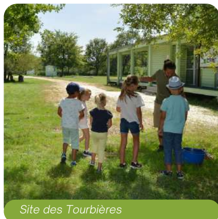
Site des Tourbières