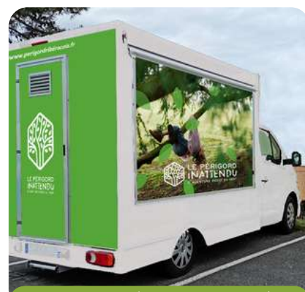
Bureau mobile (non contractuelle)