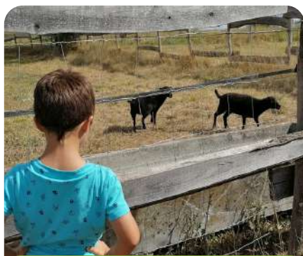
Visite de Fermes