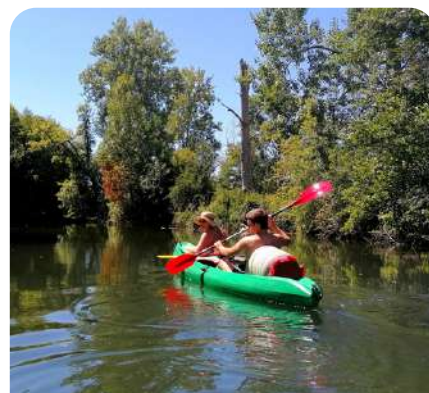
Canoë sur la Dronne