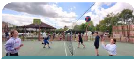
Initiation Handball - Semaine multisport

Chaque année, durant 4 jours, en avril le service participe à la semaine multisports en partenariat avec la Mairie, le Collège et le Sivos de Tocane ainsi que de nombreuses associations du territoire.