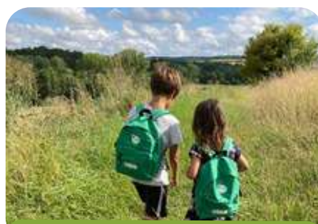
Sac à dos du petit explorateur