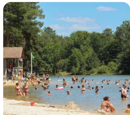
Étang de La Jemaye