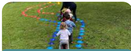
Activités de motricité pour les tout petits

Le service intervient auprès des tout petits lors des ateliers du Relais Petite Enfance. Des séances qui permettent de mettre en place les premières habiletés motrices en groupe.