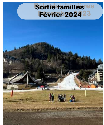
Sortie familles Février 2024

LA LETTRE INTERCOMMUNALE N°22- DÉPÔT LÉGAL JUILLET 2024 RESPONSABLE DE PUBLICATION : DIDIER BAZINET - N°ISSN: 2274-2964 8