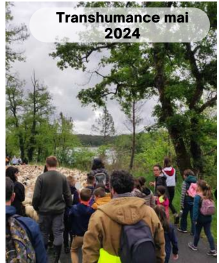
Transhumance mai 2024