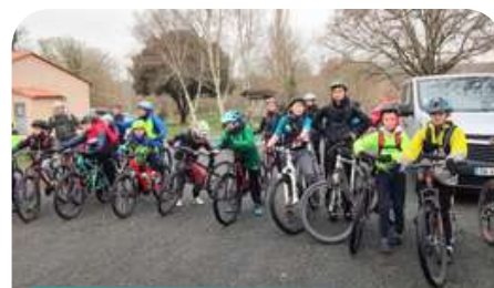
Camp itinérant à vélo

Le service a mis en place deux journées pour la formation des CM2 de Ribérac à la pratique du vélo en milieu urbain avec le passage du « Permis Vélo ». Ces journées se sont déroulées avec une partie théorique en salle, une partie atelier à vélo en milieu fermé et une partie sur la voie publique avec la circulation ouverte. Cette action a été menée en partenariat avec la Ville de Ribérac et la Police municipale de Ribérac.