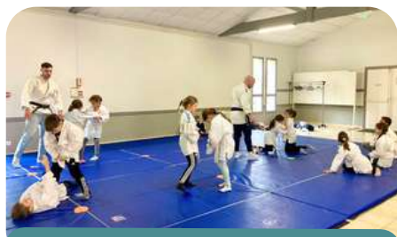
Pratique du Judo

Le service est aussi partenaire de manifestations comme la semaine olympique durant laquelle il a été proposé des activités olympiques dans différentes écoles en partenariat avec l'USEP, le Conseil Départemental, et les clubs sportifs du territoire. Ce fut le cas à Montagrier, Lisle, Tocane, Segonzac, Celles et St Sulpice de Roumagnac.