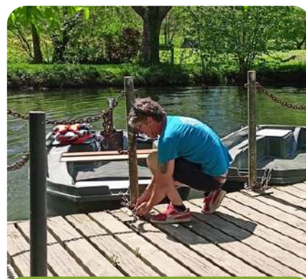
Moulin de la Maison de la Dronne