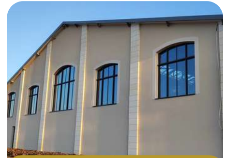
Gare imaginaire à St Sulpice de Roumagnac

La CCPR et la commune de Saint-Sulpice de Roumagnac sont ravis d'avoir pu accompagner ce porteur de projet et espèrent que de nombreux visiteurs pourront vivre une expérience inattendue et riche de découvertes en Périgord en Ribéracois.