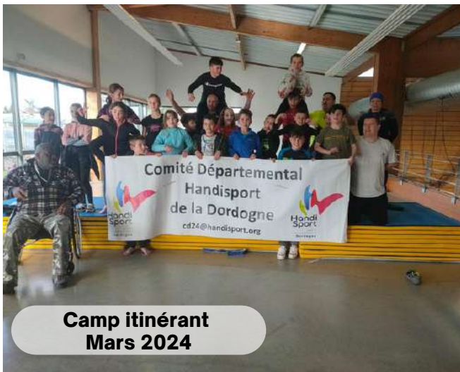
Camp itinérant Mars 2024