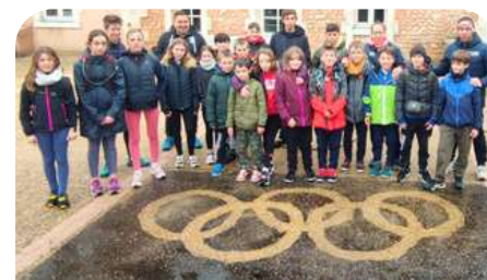
Camps "la flamme olympique"