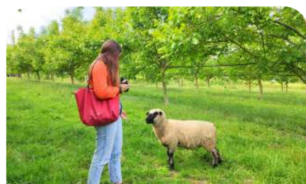
Visite de Ferme