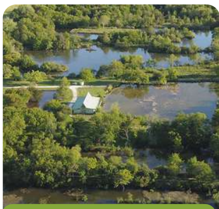
Tourbières de Vendoire (CEN)