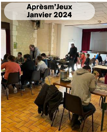
Après-m'Jeux Janvier 2024