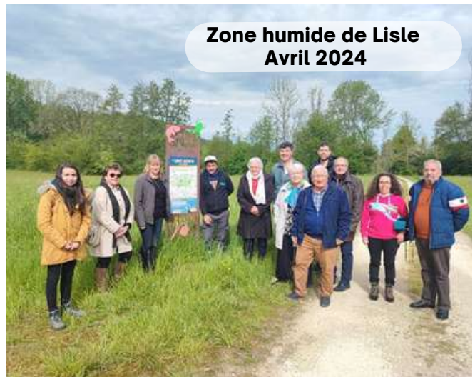
Zone humide de Lisle Avril 2024