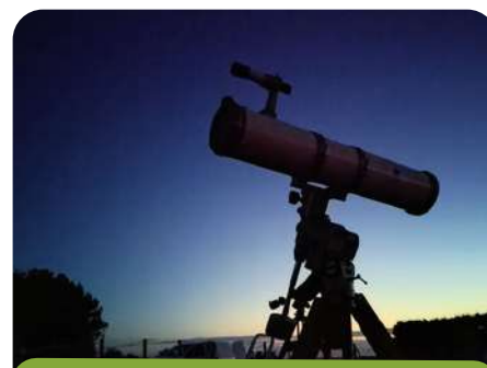
Nuit des étoiles