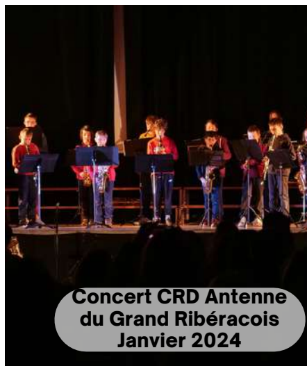
Concert CRD Antenne du Grand Ribéracois Janvier 2024