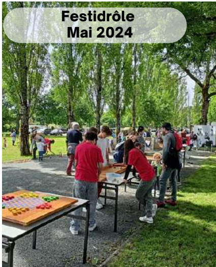
Festidrôle Mai 2024