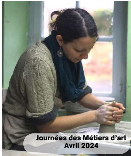
Journées des Métiers d'art Avril 2024