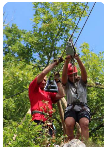
Journée des explorateurs le 7 août