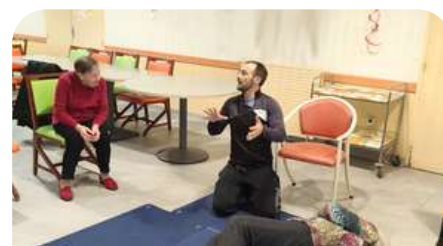
Exercices de prévention des chutes

Le service propose des exercices de mobilité adaptés dans les résidences autonomie ainsi qu'à l'accueil de jour de l'EHPAD de Ribérac. Des séances hebdomadaires qui permettent d'assurer au mieux le maintien de l'autonomie, repérer des fragilités, créer du lien social. Récemment un cycle sur les parcours moteurs (déplacements, équilibre) et la prévention des chutes a été réalisé (se mettre au sol et se relever).