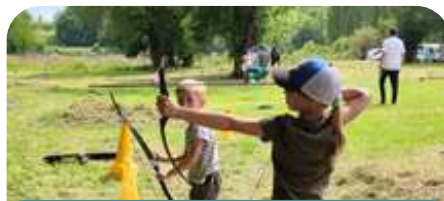
Initiation Tir à l'arc

Pendant la journée du « Festidrôle » au mois de mai chaque année des activités sportives sont proposées. Cette année c'était une initiation au tir à l'arc pour tous.