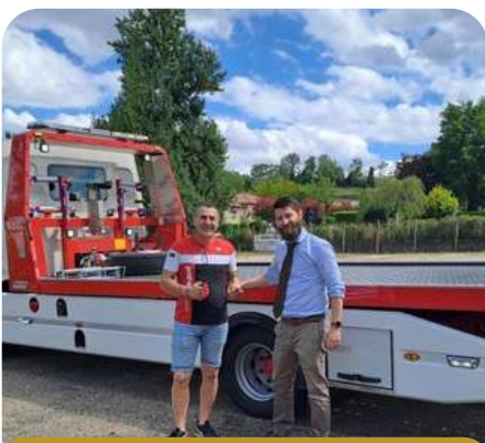
Besse et Aupy Technologies

En parallèle des travaux, dans des locaux provisoires, le gérant et son équipe de 13 collaborateurs avaient d'ores et déjà commencé à honorer leurs premières commandes et permis à ce fleuron de l'industrie ribéracoise spécialisé dans la fabrication de châssis pour engins de relevage d'être à nouveau compétitif et présent sur le marché des véhicules de remorquage.