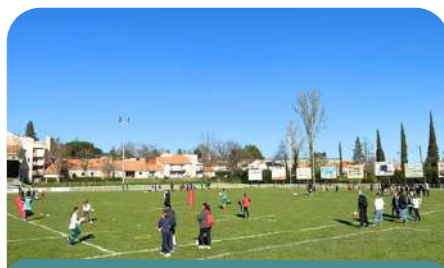
200 élèves à la journée du rugby