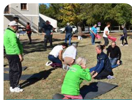
« Séniors Faites du Sport » à la Jemaye

Chaque année les éducateurs sportifs de la CCPR participent à la journée « Séniors Faites du sport » organisée par le Conseil Départemental sur le site du Grand Étang de la Jemaye. De nombreuses activités sportives adaptées, des animations ciblées y sont proposées. Une journée pleine de rencontres autour du bien-être et de la santé.