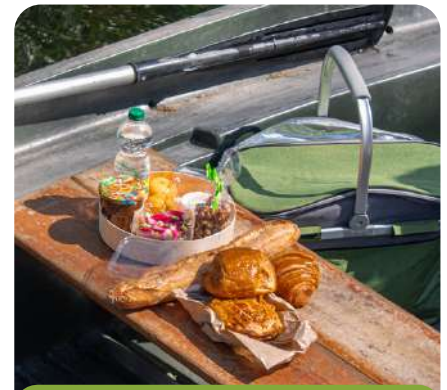
Le panier brunch sur la barque

Les participants embarquent avec un panier garni composé de produits frais et locaux, préparé par la Station des Saveurs à Tocane-Saint-Apre.