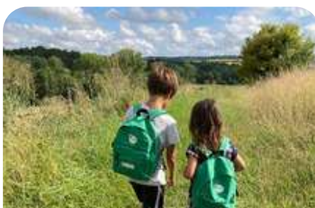
Sac à dos du petit explorateur