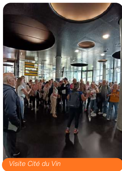
Visite Cité du Vin

Sans oublier la participation active des seniors à l'organisation du Festidrôle, témoignant une nouvelle fois de leur dynamisme et de leur implication dans la vie du territoire.