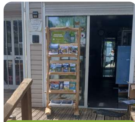
Les présentoirs sur leur lieu d'accueil

À ce jour, 10 présentoirs sont déjà déployés sur le territoire dans différents points de passage, avec l'objectif de renforcer encore la visibilité et l'attractivité du territoire.