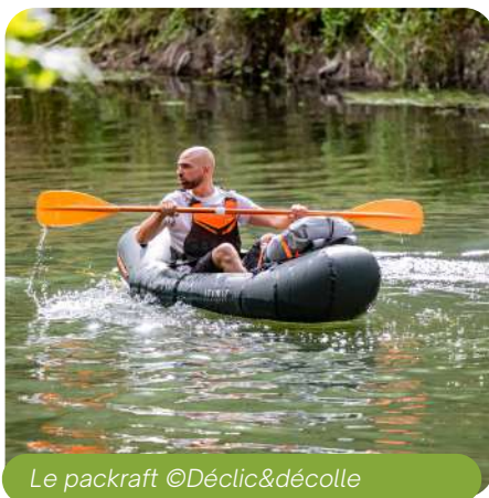
Le packraft