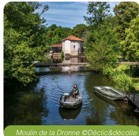
Moulin de la Dronne