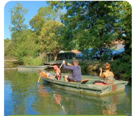
Les barques à rames