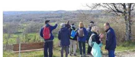
Randos du lundi