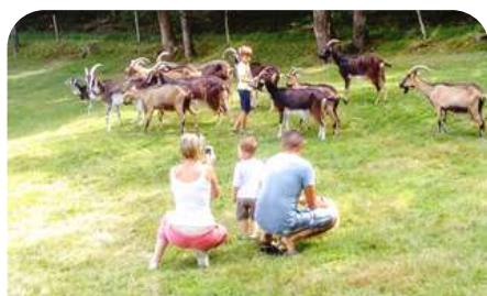
Visite de Ferme