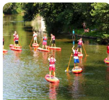
Paddle sur la Dronne