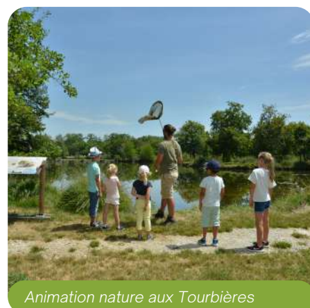
Animation nature aux Tourbières